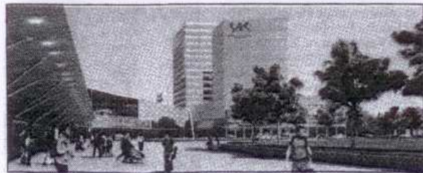
Een impressie van hoe het WTC Twente eruit zou kunnen gaan zien. Het nieuwe Metropool staat er in elk geval al.

zijn al gelegd, onder meer met bedrijven in Turkije en Frankrijk. Ondernemers uit deze regio zijn ermee in gesprek. We hopen dat er handel uitkomt.“ Een andere activiteit heet Group Trade Missions: het organiseren van handelsmissies, vice versa. Zo gaat er in de tweede helft van volgend jaar een zakelijke expeditie naar Grenoble. „Verschillende leden van onze businessclub vinden Frankrijk namelijk een interessante markt.“ Volgend jaar mei komt er een groep ondernemers uit Istanboel naar Twente. „Ze hebben ze speciale belangstelling voor Twente.“